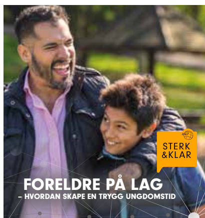
Sterk&Klar sender også ut et hefte med informasjon og gode råd til foreldre, basert på innholdet i våre foreldretreff.

Programmet har ni formidlere holder foreldretreffene rundt om i landet, men har behov for å lære opp flere for å dekke opp etterspørselen som kommer.