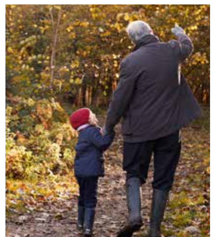
Besteforeldre er forbilder.